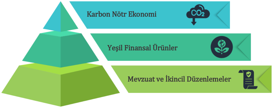
Şekil 2: Yeşil Finans Ekosisteminin Katmanlı Yapısı

Türkiye, iklim değişikliğiyle mücadele ve sürdürülebilir kalkınma hedefleri doğrultusunda, tarihsel süreç içerisinde kapsamlı bir yasal ve kurumsal altyapı oluşturarak karbon nötr ekonomiye geçiş sürecine yönelik kararlı adımlar atmaktadır. Bu çerçevede geliştirilen politika belgeleri, eylem planları ve kanuni düzenlemelerle yeşil finans alanında ekosistem desteklenmiş; sürdürülebilir tahviller, yeşil sukuk, sosyal etki tahvilleri gibi yenilikçi finansal araçların kullanımı teşvik edilmiştir. Türkiye, düşük karbonlu kalkınma yaklaşımını benimseyerek karbon nötr bir ekonomiye geçişi stratejik bir öncelik haline getirmiş ve bu dönüşümün finansmanı için gerekli hukuki, teknik ve malî düzenlemeleri adım adım hayata geçirmiştir.